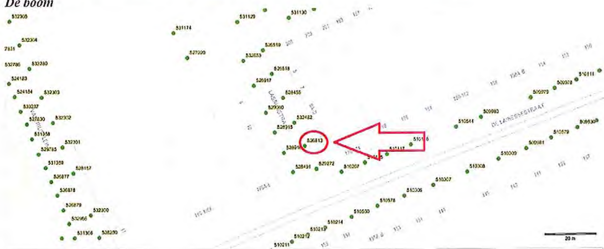
Locatie van de boom.