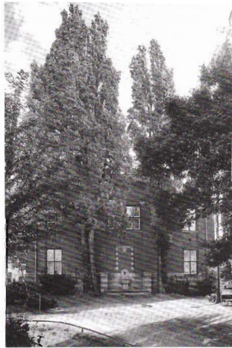
De twee bedreigde populieren aan weerszijden van het fonteinje in het J.W. van Overloopplantsoen

In de Plantage is de rust danig verstoord door een aanvraag voor een kapvergunning voor twee Italiaanse populieren in het J.W. van Overloopplantsoen, naast het voormalige Zeemanlaboratorium, Plantage Muidergracht 4. Wat is het geval? De hoogopgaande bomen voor de noordwestgevel van het monumentale laboratorium, ter weerszijden van een fraaie fontein uit de bouwtijd, blij-