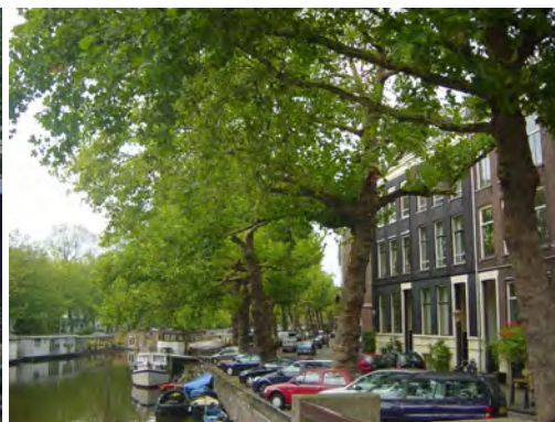
Platanen langs de Singelgracht