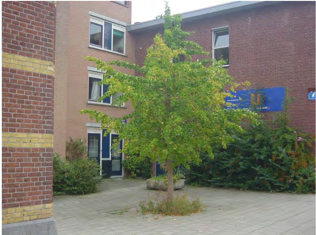
Hoogte Kadijk, zomaar een boom.

Met informele bomenstructuur (rood) wordt bedoeld dat er af en toe een boom staat in een straat, er is geen rij van bomen. Zoals bijvoorbeeld op de Hoogte Kadijk.