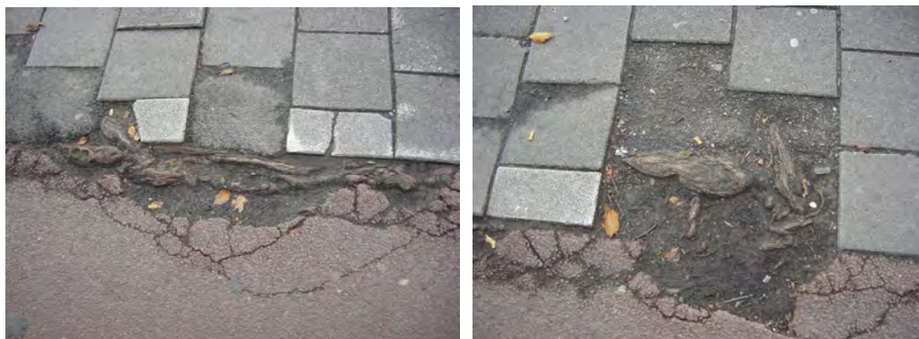
Wortelopdruk Prins Hendrikkade