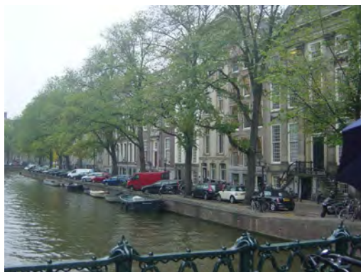
Iepen langs de Herengracht

De iep is van oorsprong een boomsoort uit een natte bosrijke omgeving in de lage landen (in Vlaanderen noemt men deze boom Olm ). De open lichte kroon, de kegelvorm en het relatief kleine blad zijn ideaal om zowel koelte te bieden als licht door te laten. De iep gedijt relatief goed in de stad. Iepen zijn in vergelijking met veel andere bomen goed bestand tegen strooizout en tegen verharding, en bovendien hebben iepen weinig takbreuk. Door de transparante piramidevormige koepel geeft de iep niet snel een volledig gesloten bladerdak, maar de bladerdichtheid is groot en de bladeren blijven lang aan de boom. Door de ruwheid van het blad en de takken is de iep in staat veel fijnstof op te vangen.