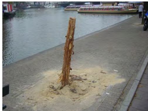
Ontbastte iep, langs de Amstel

Vooral de iepziekte is een probleem, gezien de ernst ervan en het grote aantal iepen in het centrum.