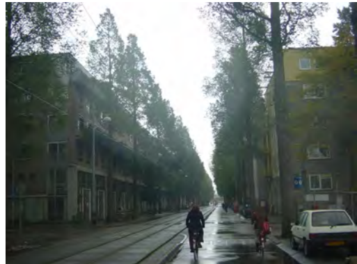
Iepen in de Czaar Peterstraat