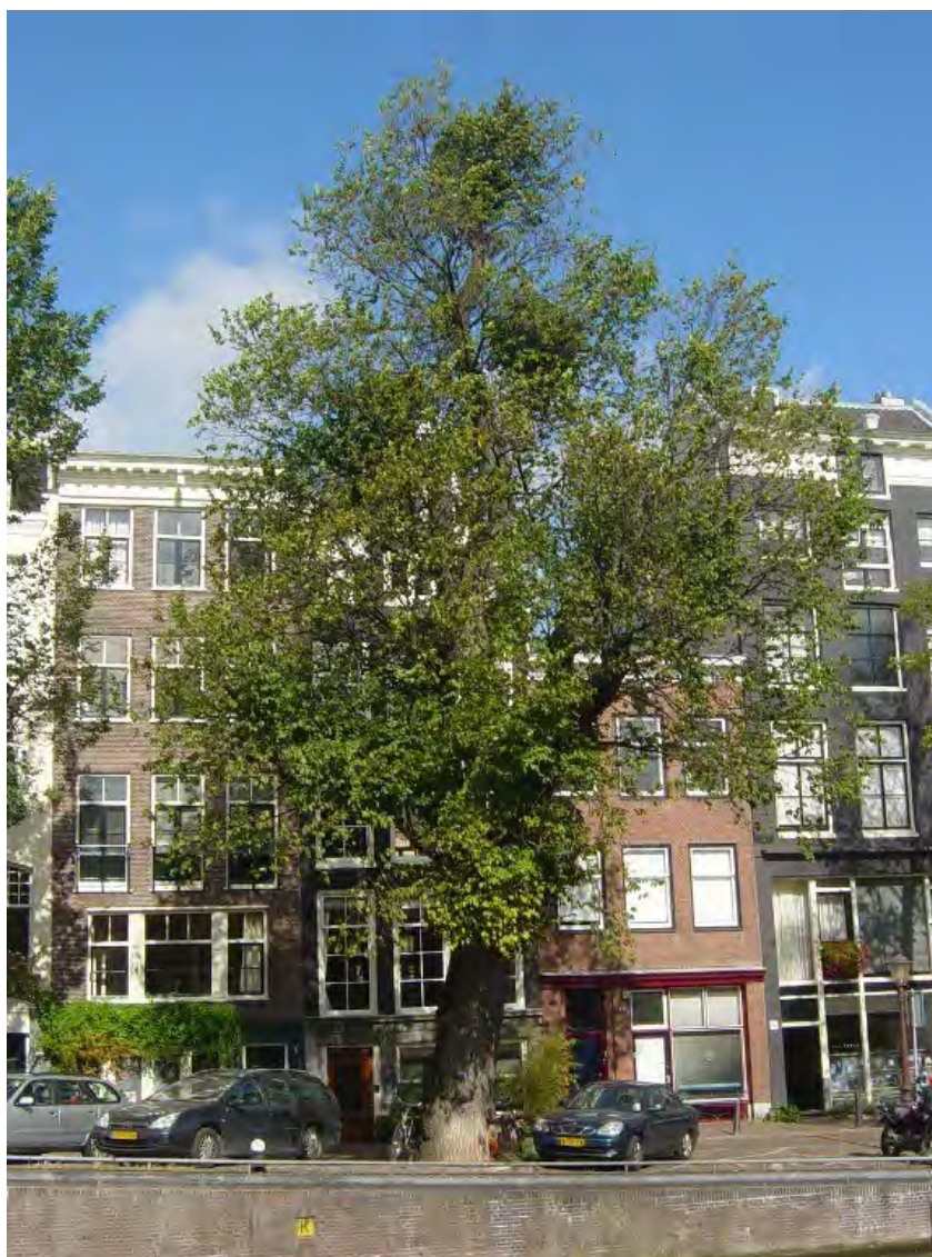
Een van de oudste lepen in het Centrum, tegenover Nieuwe Herengracht 5. De boom is gekandelaberd, wat invloed heeft gehad op de vorm.