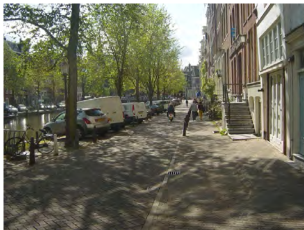
zelfde plaats, 2009