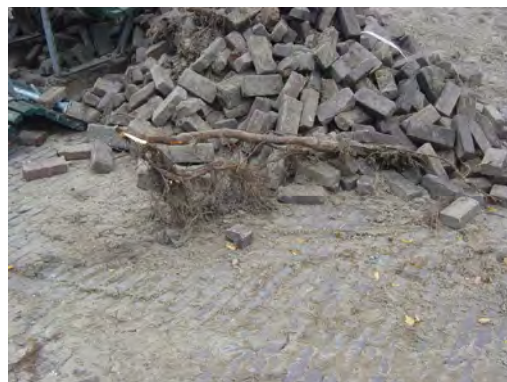
Wortelschade bij werkzaamheden, Noordermarkt