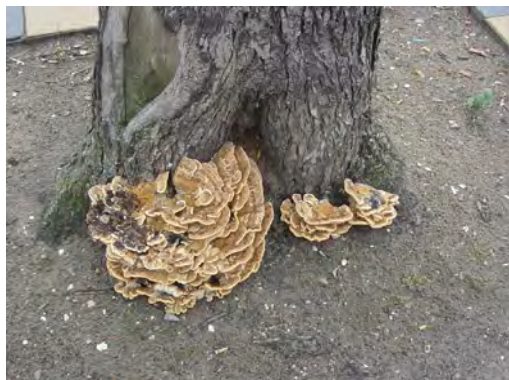
Iep aangetast door Reuzenzwam, Czaar Peterstraat